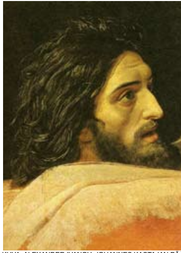
Ланде:ВИБЕЛЕЙСКНЕ СЮЖЕТЫ (Scriptural themes in Russian painting...)