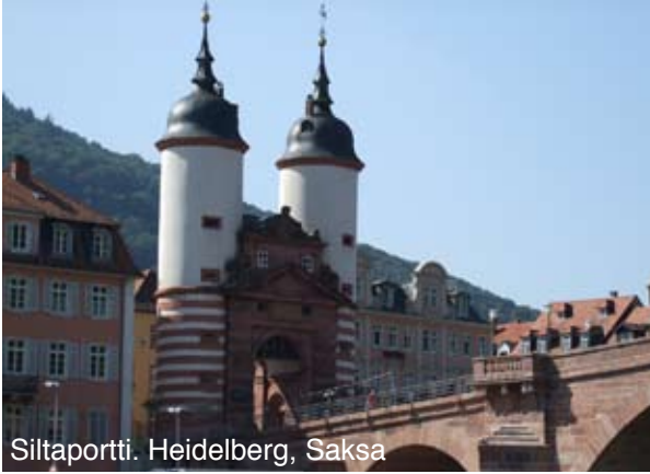
Siltaportti. Heidelberg, Saksa