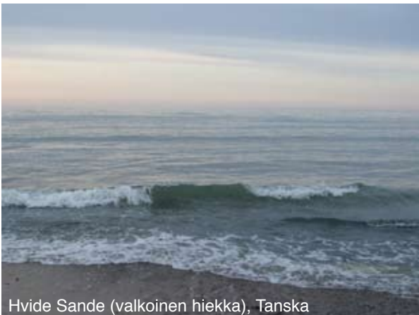
Hvide Sande (valkoinen hiekka), Tanska

”Mutta te saatte voiman, kun Pyhä Henki tulee teihin...” (Apt. 1:8).