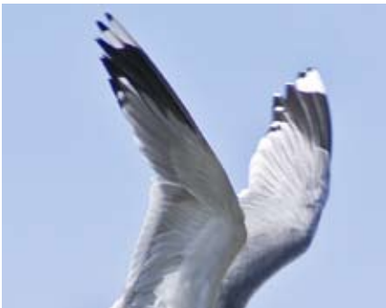
KUVA: SINIRKA MAKIVIERIKKO

”Usko on luja luottamus... ...siihen, mitä toivotaan”