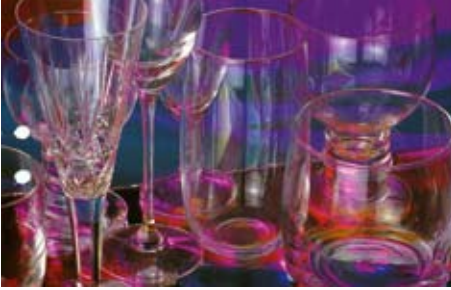
KUVA: DESIGN S.MÄKIVIERIKKO.

Kun ei nuoruudessa opettele ratkaisumallia, jossa huvia, lohtua, itsetuntoa ja rohkeutta haetaan päihteistä, sitä ei todennäköisesti kaipaa myöhemminkään.